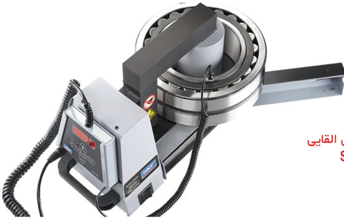
انواع گرمکن های القایی SKF TIH

شرکت SKF به عنوان یکی از مهمترین تولید کنندگان بلبرینگ در جهان، علاوه بر بلبرینگ، لوازم جانبی متنوعی نیز برای نصب، نگهداری و کنترل کارایی بلبرینگ ها تولید می کند که بکارگیری آن ها می تواند تاثیر ویژه ای بر عملکرد دستگاه و نیروی انسانی داشته باشد. به طور کلی این تجهیزات شامل انواع ابزار آلات نصب و پیاده سازی، دستگاه های کنترل کارکرد شامل دما، لرزه و صدا، روان کارهای مختلف و تجهیزات مربوط به روان کاری می شوند.