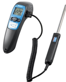
دما سنج مادون قرمز SKF TKTL