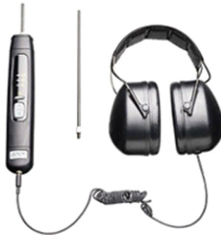
عیب یاب صوتی بلبرینگ مدل SKF TMST