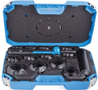
ابزار جا زدن بلبرینگ SKF TMFT