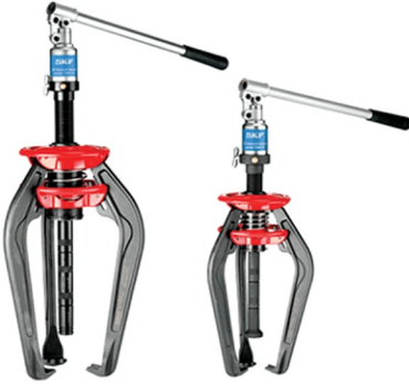
فولی کش هیدرولیک مدل SKF TMM A