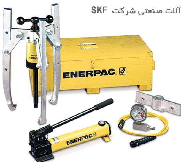
پولی کش هیدرولیک انریک Enerpac