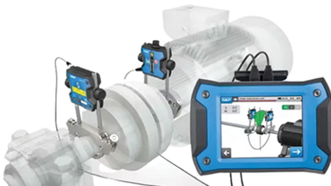
الاینمنت لیزری - ابزارهای همراستا کننده شفت مدل SKF TKBA